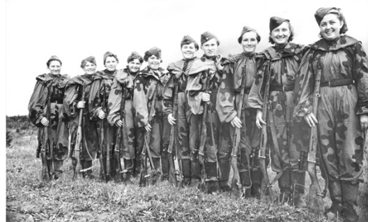
Vrijwillige vrouwelijke scherpschutters, 2de Baltische front (USSR), 1944

Op het einde van de oorlog verandert het Sovjetregime drastisch van koers en ontmoedigt het vrouwen om te kiezen voor een militaire loopbaan.