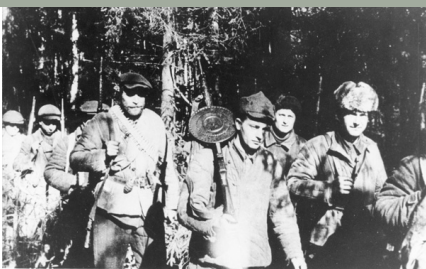
Partizanen verschuilen zich in de bossen, USSR, 1941-1945