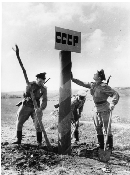
Sovjetsoldaten plaatsen een USSR-grenspaal aan de Roemeense grens, maart 1944

prijsgave. Het centraal gelegen Smolensk wordt in september 1943 heroverd. In het zuiden steken ze in oktober de voor Duitsland zeer belangrijke defensielijn van de Dniepr over. In november wordt Kiev ingenomen. Begin 1944 wordt het noordelijk