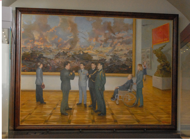
De slag om Koersk. door Pavel Boyko et Arkady Lebedev, WHI, Brussel

Het schilderij werd door de Federatie Rusland aan het Koninklijk Legermuseum geschonken.