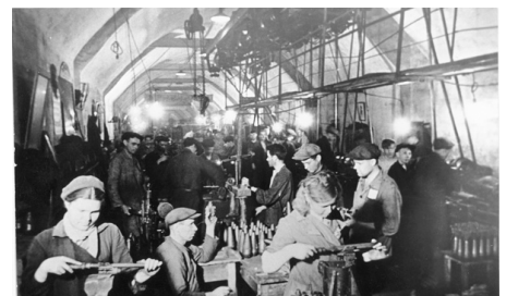
Ondergrondse fabriek, Sevastopol, 1941-45, © IWM, Londen

Na de nederlaag in Koersk beschikken de Duitsers niet meer over de middelen om een nieuwe aanval te beginnen. Dankzij troepenversterkingen, materiële versterkingen en de gewapende steun van het partizanenleger blijft het Rode Leger oprukken. De Sovjets passen de “pletwals-techniek” toe - een zware algemene stormloop in plaats van doelgerichte aanvallen in de diepte – en heroveren zo de gebieden die ze in 1941 en 1942 moesten