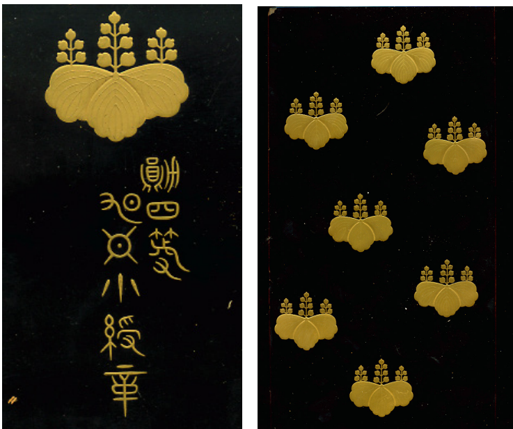
Détails du coffret contenant l'Ordre du Soleil Levant

L'Ordre du Soleil Levant est le premier ordre japonais créé le 10 avril 1875. Jusqu'à sa réforme en 2003, l'Ordre du Soleil Levant était réservé aux hommes et constituait la plus haute distinction japonaise après l'Ordre du Chrysanthème.