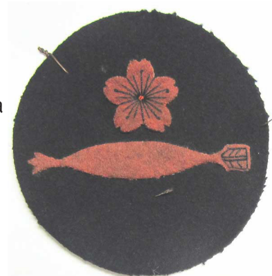
Badge de marin avec fleur de cerisier

Le mannequin de droite porte l' uniforme d'un premier matelot canonnier d'élite (UNYO HO) de la Marine impériale japonaise . Remarquez son tablier de protection en cuir typique, son chevron de bonne conduite sur le bras et la fleur de cerisier, emblème du Japon, qui était aussi celui des distinctions d'excellence dans les fonctions militaires.